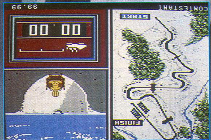
Gefährlicher Eiskanal für Bobfahrer: Gegenlenken in den Kurven