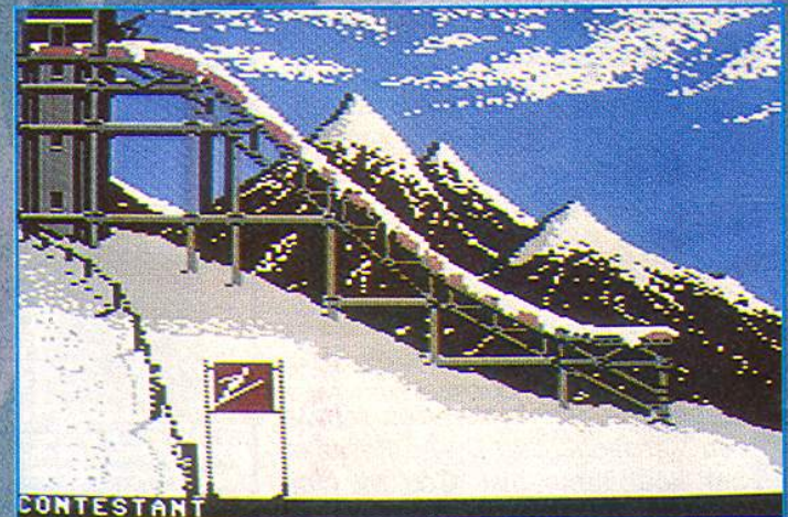
Beim Skispringen wird der beste von drei Versuchen gewertet