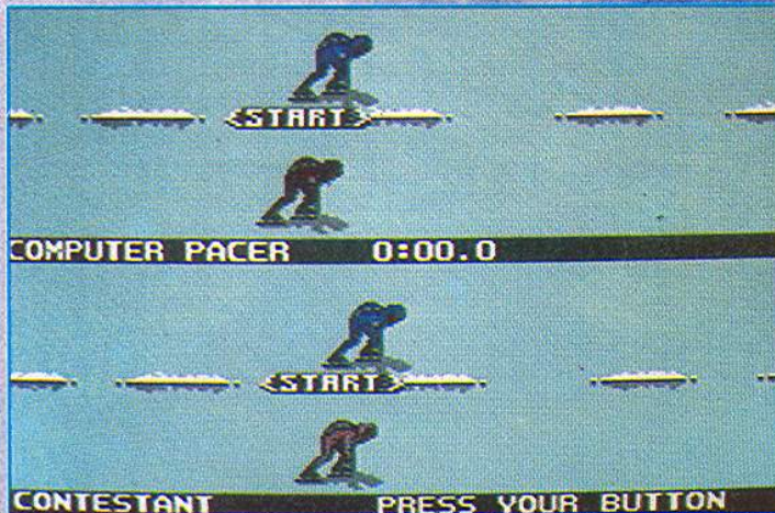
Richtiger Joystick-Rhythmus bringt Zeiten unter 30 Sekunden