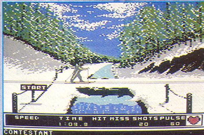
Anspruchsvollste Disziplin: Biathlon