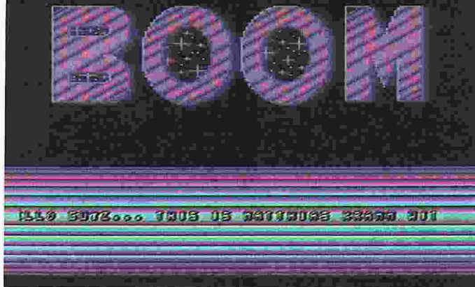
[1] Boom: Spiele-Intro mit Infos

Nach dem Entpacken meldet sich der Intro-Bildschirm (Abb. 1). Auf Knopfdruck (Joystick Port 2) geht's weiter: Zum Start in Level 1 drückt man erneut den Feuerknopf – dann baut sich das Spielfeld auf (Abb. 3). Den irdischen Abfangjäger am unteren Bildschirmrand steuert man per Joystick links oder rechts (sorry, nach oben oder unten geht nichts!).