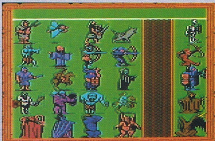
Zum Schluß ist meine Armee mächtig

»Archipelia«. Meine Armee wird beim Suchen nach der Karte durch zehn »Barbarians« und fünf »Nomads« verstärkt. Als wir in einem tiefen Wald sind, sehen wir eine Schatzkiste, in der die Karte liegt – endlich. »Archipelia« ich komme! Bei meiner Umseglung finde ich wieder mit Leichtigkeit die zwei Artefakte. Das »Book of Necros« (Erhöhung meiner Spell-Kapazität) und die »Crown of Command« (Verdoppelung der Leadershippoints). Auf meiner Suche nach der Kiste mit der Karte zu »Saharia«, hatte ich jede Menge schwerer Gegner. Zuerst verliere ich meine Noma-