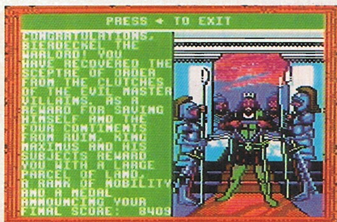
König Maximus beglückwünscht mich zu meinem Erfolg

In einem fernen Fantasy-Land regiert König Maximus. Ihm wurde durch einen Schurken das Herrscherzepter entwendet und nun muß es von einem Helden wiederbeschafft werden. Dieser heuert erst einmal einige Krieger und Monster an und zieht mit seiner Armee los. Es heißt nun vier Artefakte zu finden und eine Karte zu entschlüsseln, um dem Dieb das Handwerk zu legen. Für Kämpfe gibt es Geld, Ausrüstung und Zaubersprüche.