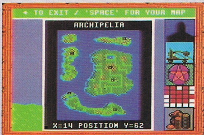
Archipelia ist einer der vier Kontinente in King's Bounty

ges Suchen. Nach etlichen Goldkisten finde ich endlich wieder neue Männer für meine Armee. Es sind »Orcs«. Ich kaufe fünfzehn Orcs, die etwas besser als meine Archers sind. Auf meiner weiteren Reise auf dem großen Kontinent schließen sich mir fünfzehn Wölfe und sechs »Dwarfs«, welche mit ihrem Hammer nicht ungefährlich sind, an. Ich habe eine Karte mit dem Weg zum zweiten Kontinent (Forestria) gefunden. Ich werde aber diesen Landstrich erst verlassen, wenn ich die zwei Artefakte gefunden habe. In den Städten erfahre ich, wer in welchem Castle zu finden ist. Zu meinen Soldaten kommen noch 25 »Gnome« hinzu, die leider eine miese Moral haben und meine Wölfe, Archers und Orcs nicht leiden können. Am Ende meiner Umsegelung, kaufe ich mir noch einige Kämpfer, bevor ich zu Maximus zurückgehe. Einen »Fireballspell« für 1500 GS erhalte ich in »Path's End«. Ich kann zwar noch nicht zaubern, aber was man hat, das hat man. Mittlerweile sind erst 27 Tage vergangen. Ich besorge mir beim König noch vier Bogenschützen. Seit meiner Fahrt hat sich einiges geändert: Ich habe 36 Leadershippoints dazubekommen und mein wöchentliches Einkommen beträgt nun 2098 GS. Außerdem hat sich mein Kapital auf 11248 erhöht. Um Zaubersprüche anwenden zu können, müßte