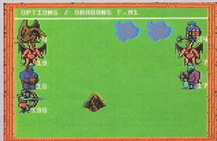
Kämpfe bringen viele Goldstücke

Nun habe ich zwei Nachrichten – eine gute und eine schlechte. Die schlechte ist, daß wir nur 180 Goldstücke (GS) gewonnen haben und die gute ist, daß ich auf einem Wegweiser einen wichtigen Hinweis entdeckt habe. Ich weiß nun, daß auf jedem Kontinent zwei Artefakte sind. Das erspart mir unnöti-