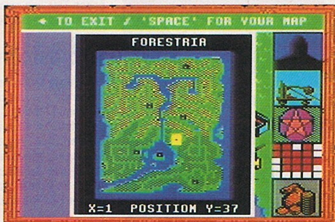
Wie Forestria schon sagt – dieser Kontinent ist reich an Wäldern