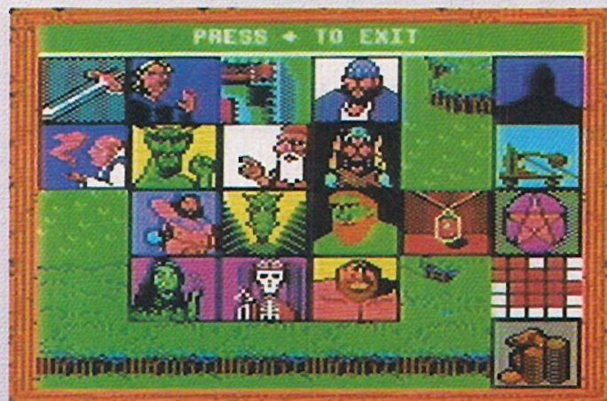
Das Puzzle zum Lösen des Spiels ist eine harte Nuß

»Giants«, welche meine Armee sehr verstärken. Da man in der Wüste nur langsam vorankommt, wird es mir langweilig und ich verlasse den Kontinent, um auf »Villain-Jagd« zu gehen. Meine Armee begleitet mich also nach »Continentia«, wo ich vier Castles überfalle. Durch meinen Drachen und meine Dämonen, habe ich keine Probleme und ergattere insgesamt etwa 55000 GS. Da ich nun genug Schurken gefangen habe (vergeßt nicht, Euch immer einen »Contract« zu holen), um befördert zu werden, segle ich zu Maximus. Er ernennet mich zum »Warlord«, was