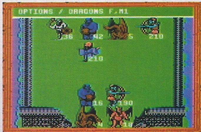
Kampf in einem der vielen Castles

nach dem Zepter behilflich sein wird. Ich muß einfach alle Castles, die in einem Wald stehen, abklappern. Aber nun nach »Saharia«. Es folgte wieder eine lästige Umseglung des Kontinents. Ich fand aber kaum Goldkisten. »Saharia« besteht hauptsächlich aus einer großen Wüste. Nur im Landesinneren sind Gebirgszüge zu finden. Diese bilden in der Mitte des Kontinents ein Labyrinth, dessen Eingang auf der östlichen Seite liegt. In der Wüste findet man keine Gegner, erst im Labyrinth. Dieses betrete ich erst gar nicht, denn es gibt dort keine leichten Gegner. Ich umlaufe die Gebirgszüge und entdecke die Zaubersprüche »Demons« und