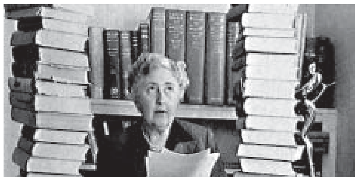
Agatha Christie: Ihr Roman aus den 30ern war auch Vorbild für eines der schwierigsten C64-Spiele.

Zur Erinnerung: Um in die Kabinen 1 und 16 zu gelangen, muss Foxworth zuerst Henry bitten, ihm zu folgen und danach versuchen, die Türe zu öffnen. Henry wird diese Aufgabe dann übernehmen.