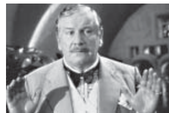
Hercule Poirot (Peter Ustinov) hatte weniger Probleme als so manche Detektive am C64.

Danach befragen wir auch noch Miss Smallworth über Henry (keine Notizen nötig). Die vorher notierte Aussage des Richters tragen wir Henry vor, den wir im Maschinenraum antreffen. Er erwidert: „He kept on asking me about the stops“ (notieren!). Wir fragen Henry, was er über Miss Smallworth weiß, notieren aber nichts. Henrys Antwort teilen wir dem Kapitän mit, der mit folgenden Worten reagiert: „Pree said she wanted to mail a letter“. Wir notieren diesen Satz und tragen ihn Daisy Du Pree (Kabine 8) vor. Sie sagt, dass der Brief in der Kommode ist. Tatsächlich finden wir dort den Brief und bringen